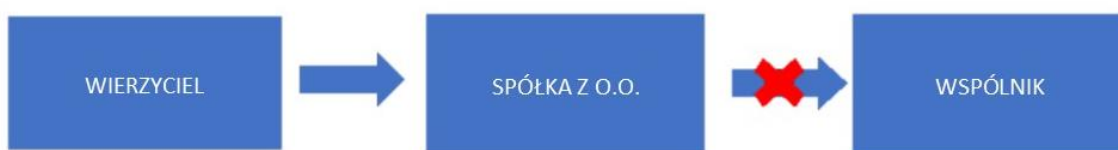
Rysunek 1: Wspólnicy nie odpowiadają za zobowiązania spółki z o.o.

Prowadzenie działalności gospodarczej nierozzerwalnie łączy się z ryzykiem i odpowiedzialnością za zaciągnięte zobowiązania. W przypadku przedsiębiorcy jednoosobowego odpowiada on za zobowiązania całym swoim, gromadzonym przez lata majątkiem . W momencie przekształcenia przedsiębiorcy w spółkę z o. o. sytuacja ta diametralnie się zmienia. Od tej pory to spółka z o.o. odpowiada za swoje zobowiązania jako odrębna osoba prawna. Wspólnicy spółki (czy też jednoosobowy wspólnik) nie odpowiadają za jej długi, nawet posiłkowo. (o wyjątku, związanym z solidarną odpowiedzialnością za długi powstałe przed przekształceniem przedsiębiorcy w spółkę w dalszej części opracowania).